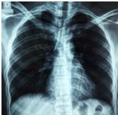
Figure 3 : radiographie pulmonaire à 3 mois